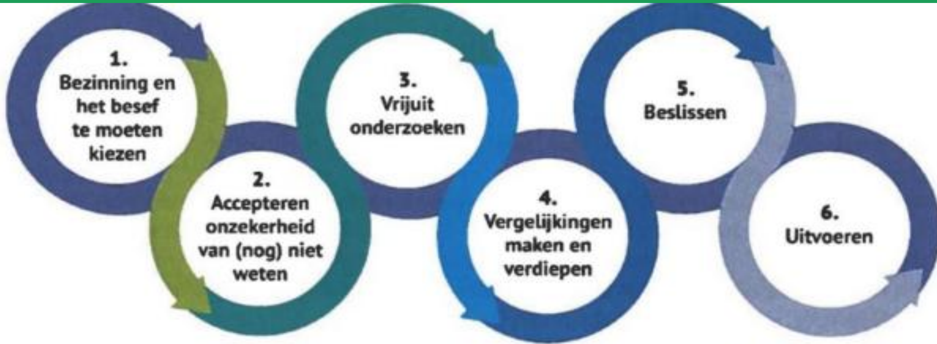
Figuur 1, De zes fasen van het keuzeproces